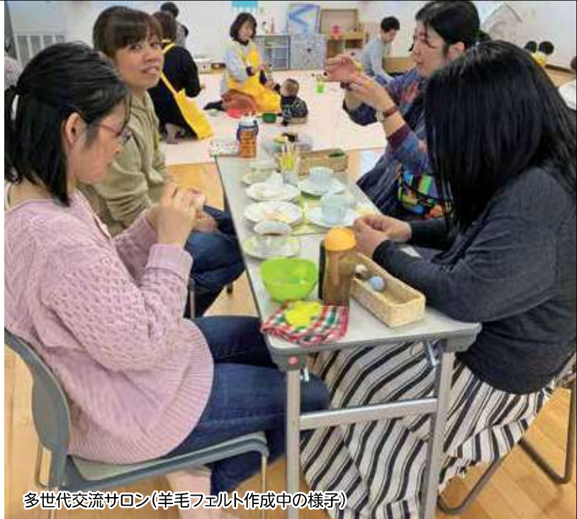
多世代交流サロン(羊毛フェルト作成中の様子)